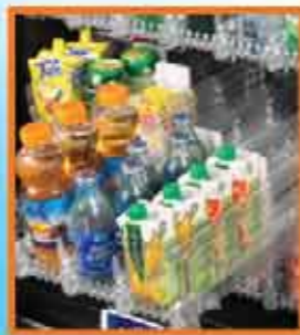
herausnehmbare Produktfächer leichte Reinigung