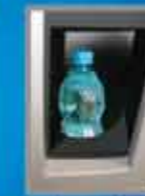
Ausgabe mit Diebstahlschutz