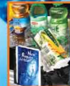
Beweglicher Werbeträger 9,5 x 14,5 cm