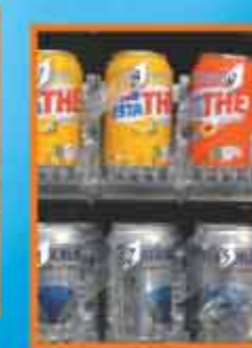
Produktalthebügel für Auswahlnummer und Preise