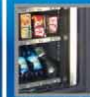
Sicherheits- / Doppelverglasung