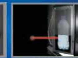
Optischer Sensor zur Ausgabesicherheit